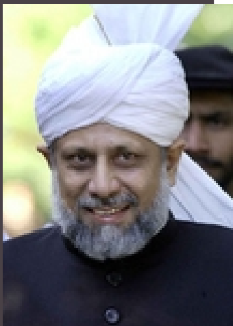
Hazrat Mirza Masroor Ahmad, Khalifat-ul-Masih V aba

Hazrat Khalifatul Masih V aba is blessing Jamaat-e-Ahmadiyya USA with his presence at our Jalsa Salana scheduled for 20—22 June 2008 at the PA Farm Show Complex, Harrisburg, PA.